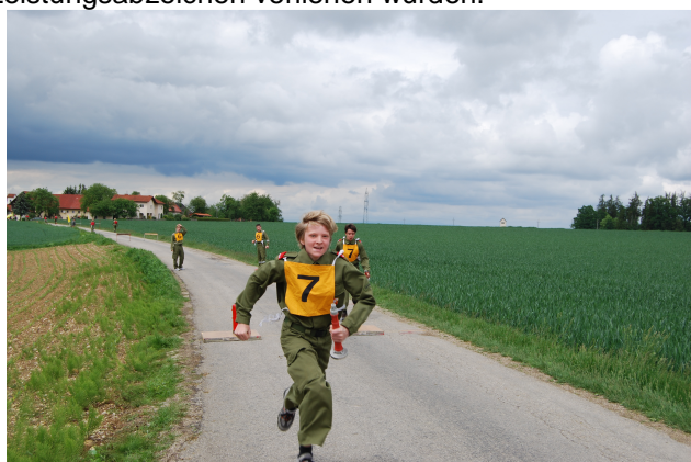
Staffellauf – Jede Sekunde zählt