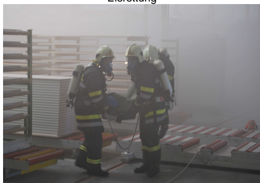
Personenrettung mit Atemschutz