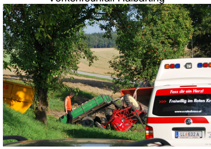
Personenbergung - Traktorunfall