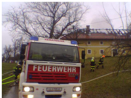
Bauernhofbrand in Rath

Im Jänner wurden wir außerdem zu einer Liftbergung alarmiert bzw. im August zu einer Personenbergung nach Rath, wo leider eine Person von einem umgestürzten Traktor erdrückt wurde und noch an der Unfallstelle verstarb. Viele Einsatzstunden wurden 2009 wieder zur Abwehr von Wetterkapriolen aufgewandt. Im Februar wurde das Gebiet Laussa von massiven Schneefällen heimgesucht, so dass der überörtliche Feuerwehralarm ausgelöst wurde. Unsere Feuerwehr war mit dem LFB-A2 und 9 Mann einen Tag lang im Schneedruckeinsatz um vier teilweise sehr abgelegene Objekte rechtzeitig von der meterhohen Schneelast zu befreien.