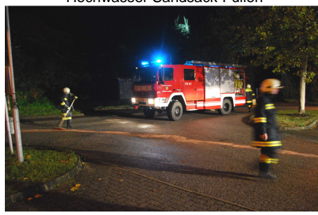
Ölspur am Gemeindeparkplatz

Bis zur Erstellung dieses Berichts wurden von der FF Kematen 60 technische und 33 Brandeinsätze durchgeführt. (In Summe derzeit 93 Einsätze 2009)